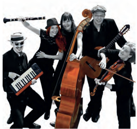
Text: https://mischpoke-hamburg.de/band/ und JP / Foto: Mischpoke

Diese Band tritt schon lange weit über den Raum Hamburgs hinaus auf und spielt auch regelmäßig in unserer Elbphilharmonie! Und nun sind sie auch wieder bei uns in Niendorf.