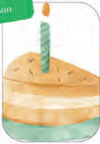
ein Stück Geburtstagskuchen