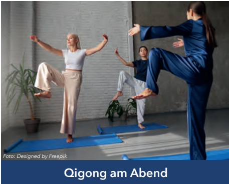
Qigong am Abend

Qigong ist eine Methode der Traditionellen Chinesischen Medizin (TCM). Es kann leicht erlernt werden und ist für alle Menschen geeignet. Die Übungen verbinden Körperbewegung, Atmung, Vorstellungskraft und innere Aufmerksamkeit. Fehlhaltungen sollen verbessert und die Selbstheilungskräfte gestärkt werden.