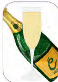
ein Glas Sekt