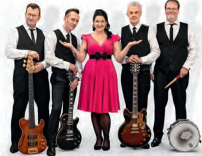
Text: JP

Großartige Musiker, stimmungsvolle Musik der 50er und 60er Jahre in Deutsch und Englisch. Ein gekonnter Mix aus Rock'n'Roll, Doo Wop, Country und Western und deutschen Schlagerperlen.