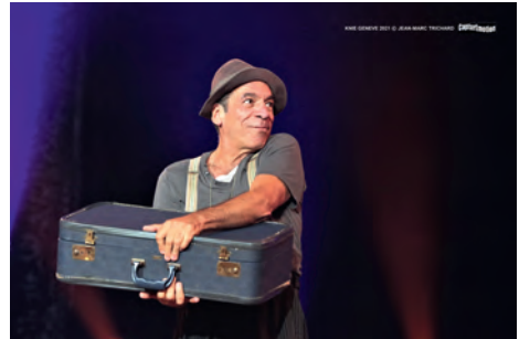
Text: JP / Foto: Knie Geneve 2021 © Jean-Marc Trichard CapturEmotion

Peter Shub wird uns im nächsten Jahr wieder besuchen und auch einen seiner sehr beliebten Workshops anbieten.