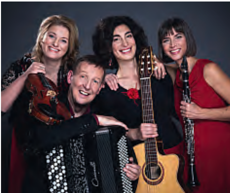
Text: TK

Und wie zu erwarten war, spielten Sie einfühlsame Klezmermusik - mal melancholisch und manchmal auch sehr schwungvoll!