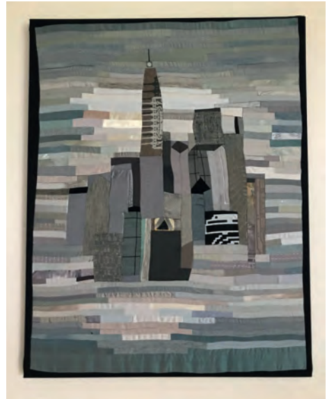
Text / Foto: Luitgard Geisler

Luitgard Geisler hat in den letzten Jahren in Hamburg und Umland ausgestellt, zuletzt in der Stiftskirche Elmshorn.