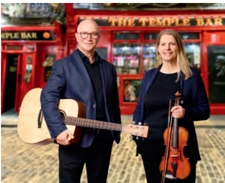
Text: JP

Das war eine beeindruckende Reise. Passend dazu Bilder berühmter irischer Autoren, die die gelesenen Texte und bekannten dargebotenen Lieder ergänzten. Der Abend endete mit der heimlichen Hymne Irlands „Molly Malone“, die den tragischen Tod einer irischen Fischverkäuferin in Dublin schildert. Besonders beeindruckend war, dass die Besucher in das Lied einstimmten und mitsangen. Das war Gänsehaut pur. Davon waren selbst die Künstler sehr angetan. Danke für diesen schönen Abend!!